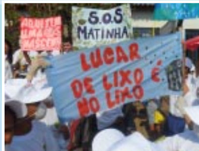
A ação em Araxá

Em Araxá, a ação também aconteceu no dia 24 pela manhã e foi realizada na Nascente da Matinha, que fica no bairro Boa Vista. A ação teve participação de aproximadamente 40 pessoas e contou com a parceria da Escola Oratório Nossa Senhora Auxiliadora.