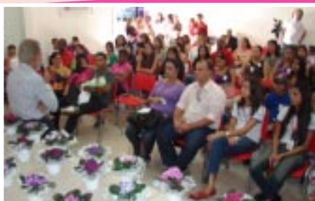
O evento em Uberlândia

Em Uberaba, a ação aconteceu no dia 16 de setembro. Esta foi a segunda palestra do ano na unidade e, desta vez, não só para as mulheres da Uberlândia Refrescos, mas também da comunidade do bairro Tutunas, atendidas pela Unidade Mista de Saúde João Resende. A palestra abordou questões como ingestão de bebida alcoólica durante a amamentação e alimentação e sexo