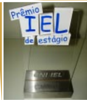
Prêmio IEL de Estágio 2010 etapa nacional