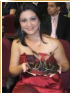
Prêmio IEL de Estágio 2010 etapa regional