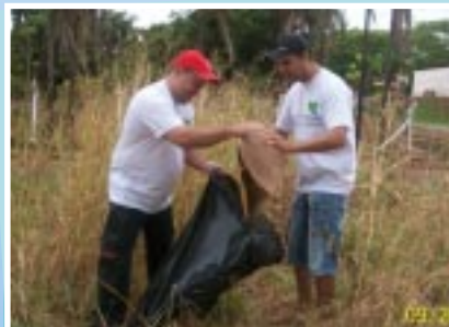
A ação em Ituiutaba

Já em Patos de Minas, a ação foi realizada no dia 2 de outubro, às margens do Rio Paranaíba, realizando um mutirão ecológico para a limpeza de mananciais e nascentes do Rio Paranaíba e dos bairros adjacentes. A ação teve participação da Prefeitura de Patos de Minas, Limpebraz, Corpo de Bombeiros e associações dos bairros envolvidos.