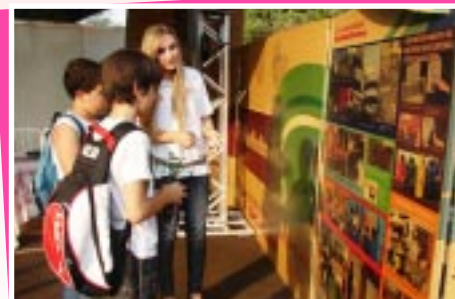
Alunos visitando o estande

A empresa participou do evento com o estande da sustentabilidade e apresentou suas práticas de gestão ambiental e de estágio que contribuem para o desenvolvimento sustentável.