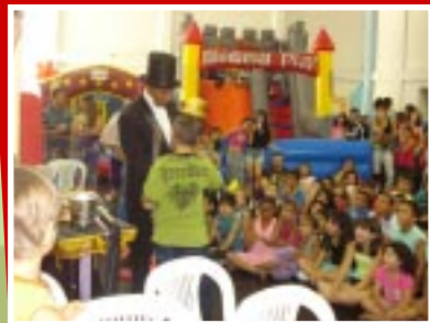
Show de mágica

Nas unidades, a comemoração também foi muito divertida. Em Ituiutaba , a data foi comemorada com muita energia, pipoca e algodão, além de diversos brinquedos. Em Patos de Minas , a festa contou com cama elástica, piscina de bolinhas, pintura no rosto, tapete dance e Guitar Hero. Em Uberaba , brinquedos, pipoca, algodão doce e cachorro quente. Já em Araxá , a festa contou com pula-pula, touro mecânico, tobogã, pipoca, algodão doce e cachorro quente. E todas, é claro, com muitos produtos Coca-Cola.