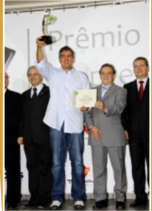
Prêmio Empresário Herói 2010

Estas conquistas reforçam o competente trabalho das equipes da Uberlândia Refrescos que estão, a cada dia, mais empenhadas na busca pela melhoria contínua.