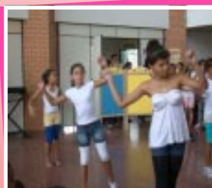
Apresentação de dança

O evento contou também com a participação da Banda da Polícia Militar, da equipe do SENAC, com serviços de corte de cabelo, pintura no rosto, teatro de fantoche sobre sustentabilidade e oficina de tangram.