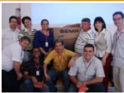
Equipe de TH e Financeiro