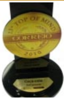
Top of Mind Jornal Correio