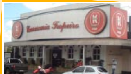
A Churrascaria Tropeiro

As churrascarias dos irmãos Mocellin fazem sucesso na cidade, pois possuem produtos e atendimento de excelente qualidade, local e preço diferenciado. Com perfil voltado para as classes A, B e C, as churrascarias não são concorrentes, mas complementares, e aliam a tradição do churrasco gaúcho às modernas instalações. É por essas razões que eles são grandes parceiros da Uberlândia Refrescos - porque têm uma proposta diferenciada, sempre investindo em serviços, produtos e atendimento da mais alta qualidade. O sucesso do negócio é o resultado desse cuidado. E o sucesso é tanto que os irmãos não param de investir. A Churrascaria Tropeiro está ampliando as insta-