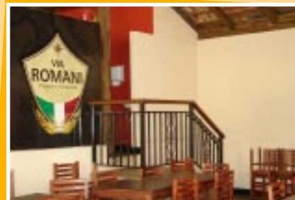
A Casa Noturna Via Romani

no bairro Copacabana, possui estacionamento próprio e local para a criança brincar. Ótima opção para curtir a noite com qualidade.