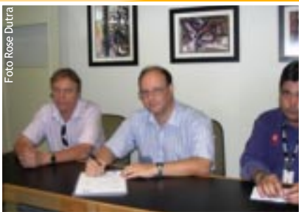
A assinatura do contrato na Uniube

Uniube - No dia 24 de agosto, a Uberlândia Refrescos e a Universidade de Uberaba (Uniube) assinaram contrato de exclusividade Coca-Cola tanto para o campus de Uberlândia quanto para o de Uberaba. O convênio irá beneficiar os permissionários dotando os espaços de alimentação de melhor estrutura, garantindo, além dos melhores produtos do mercado, atendimento de qualidade.