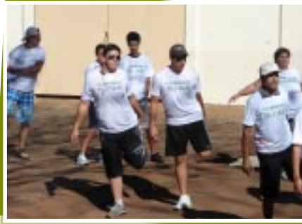
Colaboradores se alongando