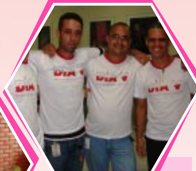
Voluntários após a doação