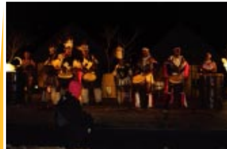
Apresentação cultural do país sede da Copa de 2010