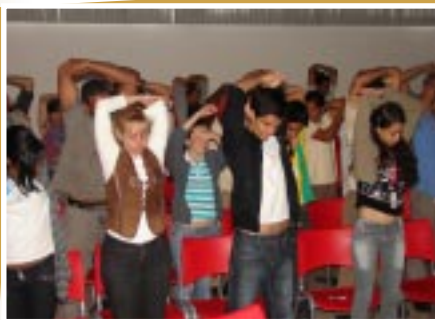
Colaboradores em alongamento