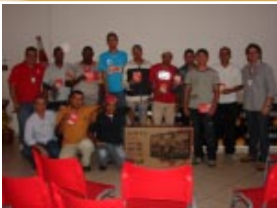
Colaboradores exibindo os prêmios

Foi realizado, em agosto, o sorteio de prêmios do concurso Still Beverages, que vigorou nos meses de maio e junho deste ano. Todas as áreas da empresa participaram. A premiação foi atrelada ao atingimento de metas comerciais e individuais; cada funcionário pode participar com até 7 cupons, de acordo com o atingimento das metas. O envolvimento e comprometimento dos colaboradores foram excelentes, assim como o resultado.