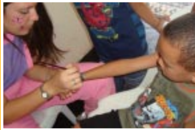
A pintura fez sucesso