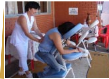
Momento de relaxamento