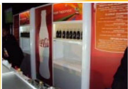
Uma das estruturas da Coca-Cola no evento