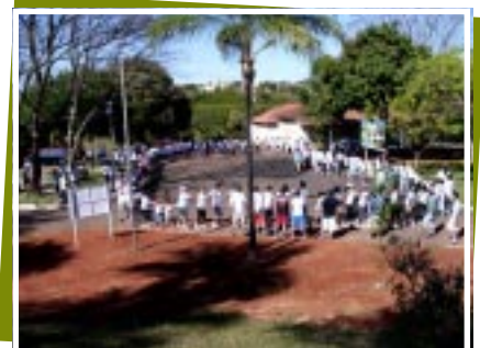
Evento promoveu a integração