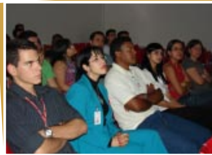
Equipe atenta as palestras

Foram semanas muito produtivas que possibilitaram, além de grande interação entre os funcionários, maior abrangência do conhecimento sobre as práticas de prevenção de acidentes de trabalho e doenças ocupacionais.