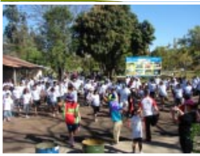
Grande participação da equipe

Foram distribuídos camisetas, frutas e Coca-Cola Light Plus, além de picolés de fruta. Ano que vem tem mais!