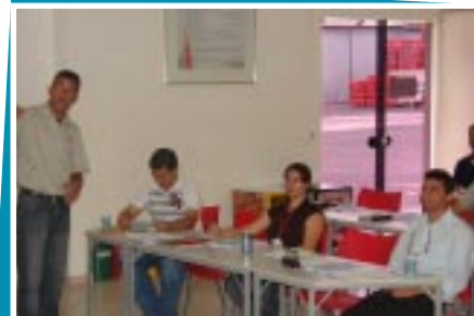
Colaboradores em treinamento