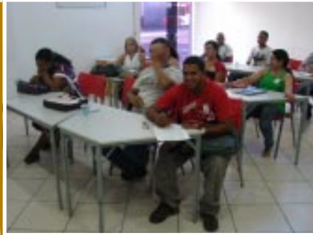
Alunos em sala de aula

Na segunda semana de dezembro foi realizada a confraternização dos alunos do programa Telecurso em comemoração ao encerramento do semestre letivo. Realizada na sala de aula da Uberlândia Refrescos, a confraternização teve lanche e troca de presentes do Amigo Invisível. Em 2010, tivemos 59 pessoas participando do programa entre colaboradores e familiares. Destes, 29 alunos concluíram o ensino médio - vinte e dois colaboradores e sete familiares.