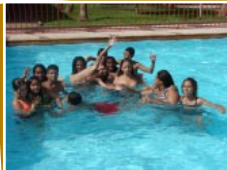
Alunos comemoram em excursão no Clube Ibioporã