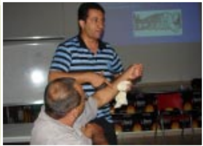
Instrutor orienta equipe

De 29 de novembro a 3 de dezembro, foi realizado na unidade Uberlândia o curso da Comissão Interna de Prevenção de Acidentes - CIPA. Foram definidos os membros da comissão e realizado treinamento sobre temas referentes à segurança do trabalho como inspeção de segurança e identificação de riscos, além do uso de EPIs e primeiros socorros, entre outros.