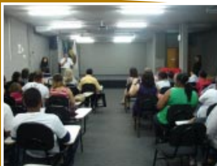
O evento de formatura