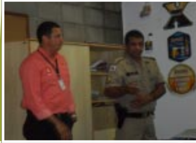
Palestra sobre Segurança no Trânsito

A unidade Araxá realizou em novembro a Semana Interna de Prevenção de Acidentes de Trabalho - SIPAT - que tem o objetivo de orientar e conscientizar funcionários sobre a importância das práticas de segurança. Foram abordados temas como segurança do trânsito, segurança no trabalho, DST, reciclagem e saúde.