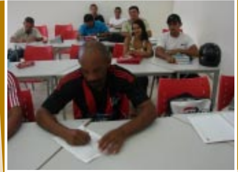
Atentos à aula